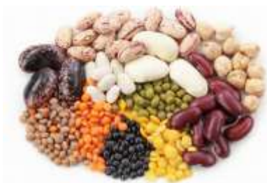
bab, borsó, lencse